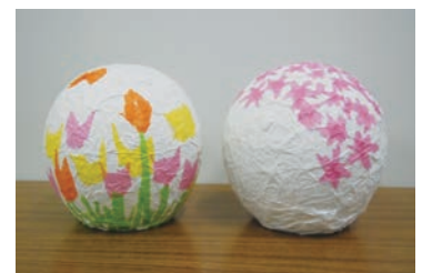
春のランプシェード

日時：4月15日(土)、16日(日)、23日(日)、29日(土・祝)、30日(日) 10:15・12:15・14:00・15:30 各回約60分 ※4月30日(日) 15:30の回は、定期入館券WEB会員限定イベントとなります。 定員：各回12名 対象：小学生以上(未就学児は保護者が作製。保護者1名につき未就学児2名まで購入可。参加券1枚につき作製は1名のみ。) 参加費：600円 ※当日1Fインフォメーションにて参加券販売、別途入館料が必要。購入時に入館券をご提示ください。(未就学児は保護者の入館券) 風船に半紙を貼り重ね、桜の花びらや葉の形の模様を付けて、春らしいランプシェードを作ります。 光の三原色の実験も行います。