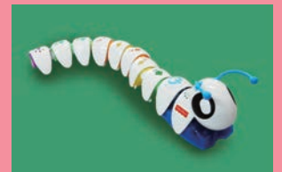
イモムシ型ロボットでプログラミングに挑戦!

日時：3月18日(土)～4月4日(火) 9:30～17:00 参加費：無料(入館料別途) 土・日・祝日に開催している各種イベント教室のリニューアルに伴い、教室の紹介をするとともに、無料で体験することができる企画展です。