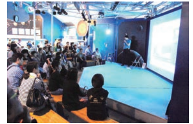
ウィークエンドレクチャー

日時：3月18日(土)～26日(日) 土日 13:00 各回約30分 対象：どなたでも 参加費：無料(入館料別途、土曜日は高校生以下入館も無料) 火星、木星、土星など、太陽系の観測は、人類共通の目標のひとつです。 日本のみならず、世界各国の探査機が観測した太陽系のすがたを紹介します。