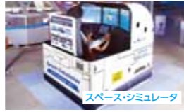
スペース・シミュレータ