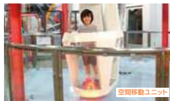
空間移動ユニット